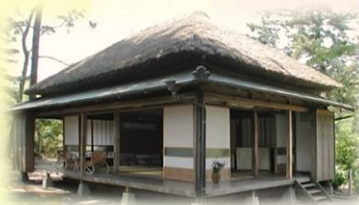
芥川荘 (芥川龍之介が恋文を書いた離れ家) 千葉県 芥川龍之介ゆかりの宿「一宮館」