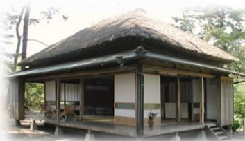
芥川荘 (芥川龍之介が恋文を書いた離れ家) 千葉県 芥川龍之介ゆかりの宿 一宮館